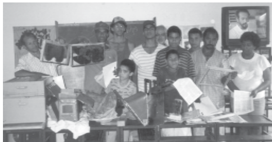
Curso de Apicultura e Manejo, promovido pela AMPRUT-Associação de Moradores e Produtores Rurais do Taquari

Assa-peixe - Também indicado para tosse, gripes, resfriados e