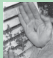
Colocação da abelha-rainha na caixa