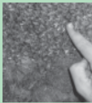
Identificação da abelha-rainha no enxame