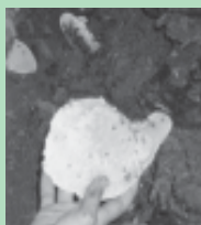
Retirada dos favos