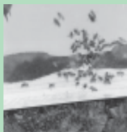
Abelhas entram na caixa, atraídas pelo cheiro da abelha-rainha