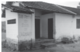
Posto de Saúde, uma das prioridades da nova diretoria

Definiu-se prazo até 24 de outubro de 1999 para inscrição das chapas; b) Data para eleição, 12 de dezembro de 1999; c) Locais para votação: escolas do Taquari e uma unidade móvel; d) Formação de uma Comissão Eleitoral.