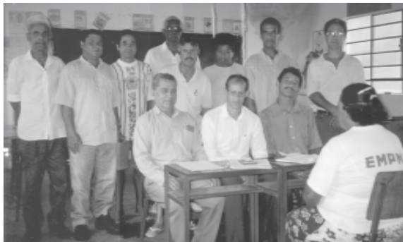
Nova diretoria eleita da AMPRUT

Em relação às políticas, definiu-se: a) formação de chapas para concorrerem às eleições de 12 de dezembro de 1999; b) plataforma e o tipo de gestão; c) criação de um veículo para irradiação das políticas e projetos a serem desenvolvidos. Quanto aos prazos: a)