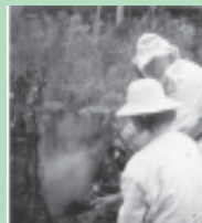
Aplicação de fumaça para acalmar as abelhas