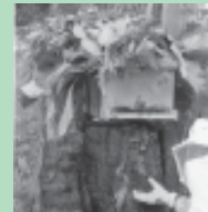
A caixa é colocada no local onde estava a colméia, para que as abelhas se adaptem à nova colméia